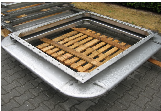
Compensatoren 1600 x 1600mm. Balgelement en flenzen: 1.4571