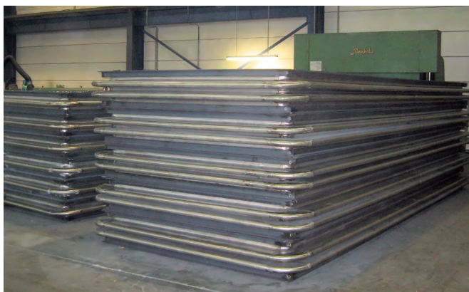
Ketel compensatoren 2000 x 6000mm.

Door deze aanpassingen verminderde de materiaalspanning in de balgelementen aanzienlijk, wat een langere levensduur van de compensatoren tot gevolg zal hebben.