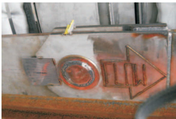
Detail scharnierstuk compensator