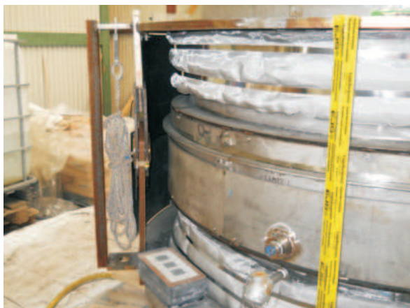
Compensator, scharnierstuk en testansluitingen

Door expertise en ervaring (UOP gecertificeerd) op het gebied van deze specifieke compensatoren, waarbij een zeer hoge mate van bedrijfszekerheid gegarandeerd moet worden, kon de doorlooptijd beperkt blijven.